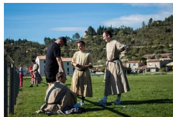
Sur le terrain de foot du village.