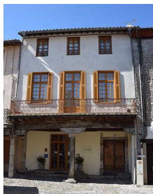
11 Rue des Deux Ponts.

Sont classés par arrêté du 27 août 1931 la pile en pierre à chapiteau sculpté avec son sommier de bois ; les deux corbeaux en bois, la grande poutre qu'ils supportent et les solives moulurées formant couvert, de la façade.