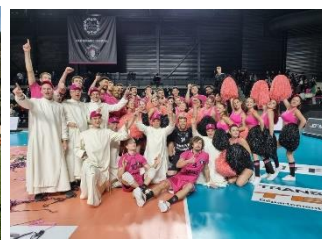
Mascottes du Club de Volley de Narbonne.