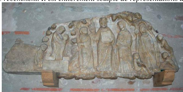
Le tympan de l'église de Cabestany.

Nous sommes en 1935. Le curé de la paroisse décide de faire rénover son église qui le méritait bien. Les travaux permirent la mise à jour d'un tympan sculpté en forme de demi-cercle de 2 mètres de long sur 1 de haut. Fait de marbre blanc, ce décor était le tympan d'une ancienne porte percée dans le mur Nord, une porte disparue et dont on a récupéré cette pièce pour orner une nouvelle porte maçonnée récemment. Il est entièrement sculpté de représentations de la vie de la Vierge.