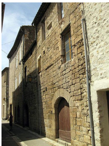
29 Boulevard de la Promenade.

De cette maison du XIV ème siècle, est classée, par arrêté du 13 avril 1948, la façade, sauf une partie surélevée plus tard, est entièrement appareillée. Les ouvertures comprennent, au rez-de-chaussée, deux grands arcs surbaissés et deux lucarnes ; au premier étage, trois fenêtres géminées en plein cintre. Le comble était éclairé par deux petites lucarnes. Trois fenêtres géminées éclairaient la salle du premier étage. Il n'en reste que l'encadrement. Chacune des formes était couverte par une fausse arcature constituée par un bloc de grès tendre, entaillé suivant un plein cintre. Les chapiteaux et colonnettes ont disparu.