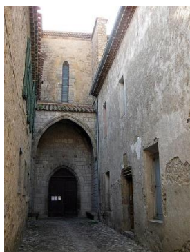
16 Rue Paul Vergnes.

Jouxtant l'église, la maison presbytérale, classée par arrêté du 15 décembre 2020, ne fut édiflée qu'après 1457. Les armoiries permettent de fixer approximativement la date d'exécution des peintures du plafond du premier étage, avant le 6 décembre 1491, grâce au blason France-Bretagne, mariage de Charles VIII. Le blason du pape Innocent VIII fixe l'autre limite au 25 juillet 1492, date de sa disparition.