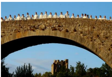
La Communauté sur le Vieux-Pont.