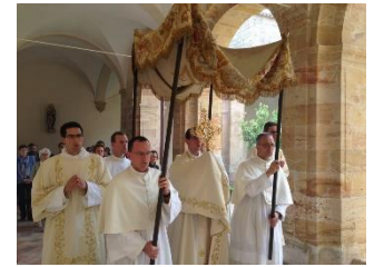
Fête-Dieu dans le Cloître.

Dans cette abbaye fondée par Charlemagne en 779, ils sont à ce jour plus de 30 religieux, dévoués à la vie contemplative et à l'apostolat, l'un et l'autre fondés dans la vie commune.