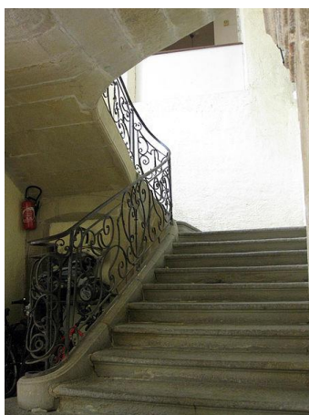
Place de la Bouquerie.

La rampe d'escalier est classée par arrêté du 27 avril 1948. Cette rampe en fer forgé est ornée, au centre, d'un monogramme qui est peut-être celui de Charles Audier, devenu Premier Consul de Lagrasse en 1771, qui aurait fait construire cette impressionnante demeure au centre du nouveau bourg, sur l'autre rive, en face de l'abbaye.