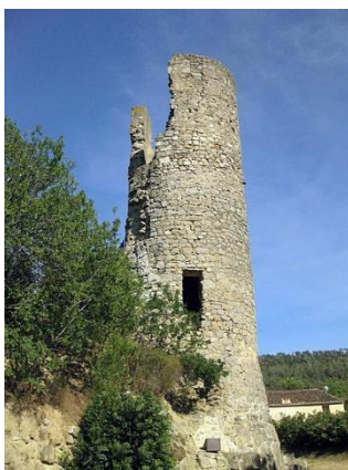
1 Chemin de la Tour.

Par arrêté du 20 mai 1930, sont classés la Tour de Plaisance et les restes de remparts contigus. Périodes de construction : XII ème – XV ème siècles. Cette tour est la seule qui subsiste de l'ancienne enceinte fortifiée du village, distincte de celle de l'abbaye. Il ne reste des remparts que la partie longeant la rivière.