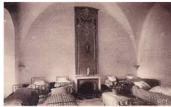
Salle au 1 er étage.