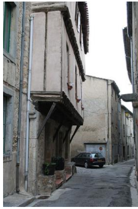
4 Bis Rue des Mazels.

Sont classés par arrêté du 13 avril 1948, l'escalier en vis et sa porte extérieure ; les parties du 16 ème siècle de la façade ; consoles et peintures entre les poutrelles.