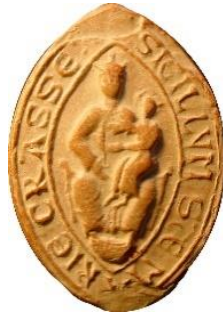
Premier sceau connu de l'abbaye de Lagrasse, 1215.

On y voit la vierge Marie, patronne de l'abbaye, assise sur un siège à accoudoirs, couronnée, portant l'enfant Jésus nimbé sur son genou gauche et une palme dans sa main droite. Autour se développe la légende SIGILLVM S(AN)C(T)E. MARIE CRASSE. Ce sceau était appendu à une sentence arbitrale réglant les différends entre Simon de Montfort et l'abbaye de Lagrasse, datée de Carcassonne, au palais, 24 août 1215.